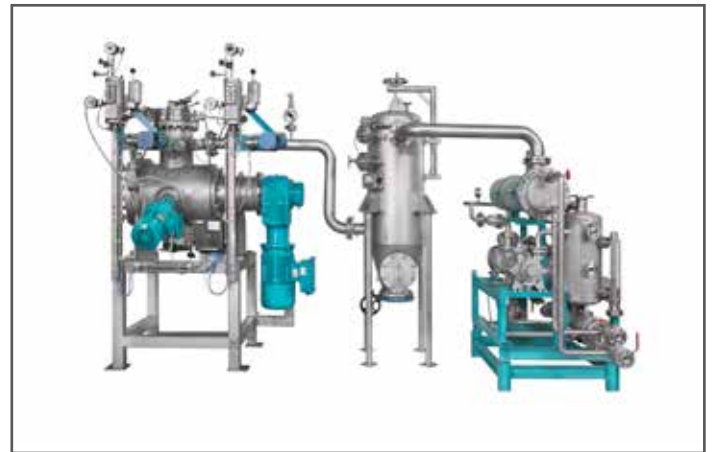
DVT 130 für Entwicklung und Kleinproduktion