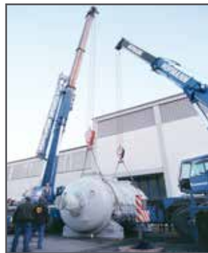
Verladung DVT 55.000